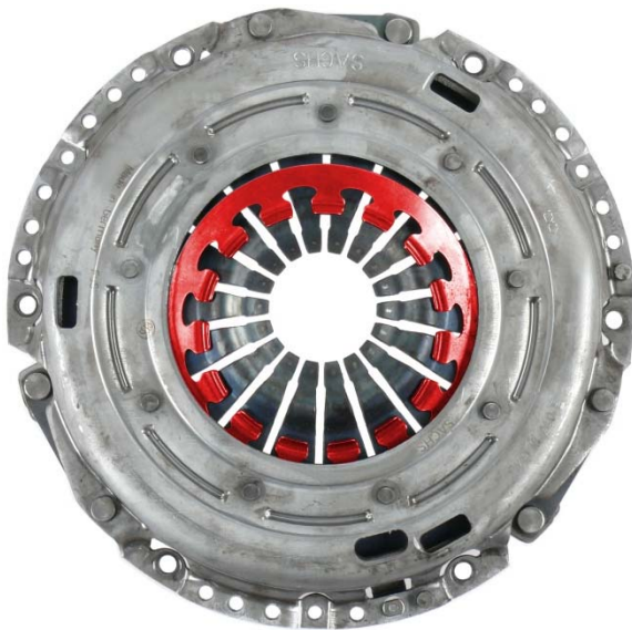
Fig. 4: Ressort auxiliaire déplacé

Vous trouverez d'autres informations de service ici : www.zf.com/serviceinformation